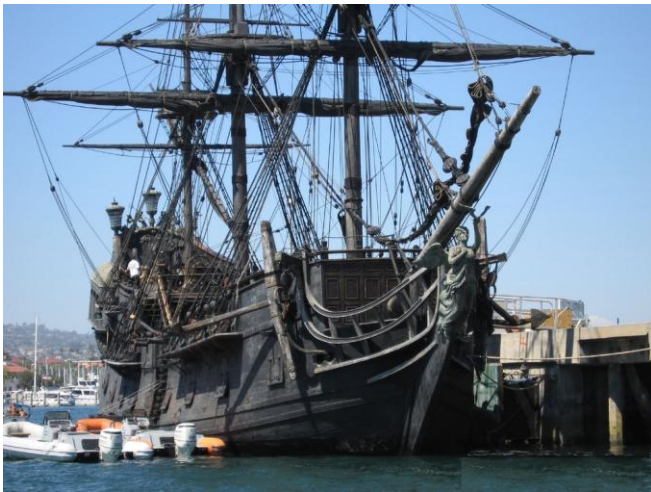
LE BLACK PEARL Devinette n° .....