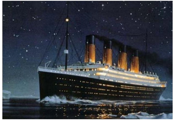
LE TITANIC Devinette n° .....