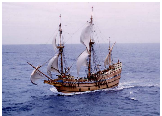
LE MAYFLOWER Devinette n° .....