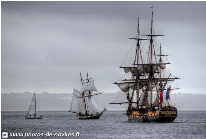
L'HERMIONE Devinette n° .....