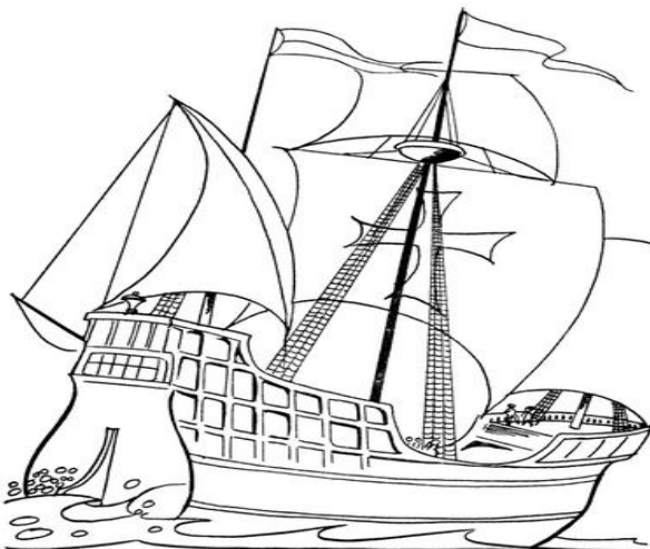
LE SANTA MARIA Devinette n° .....