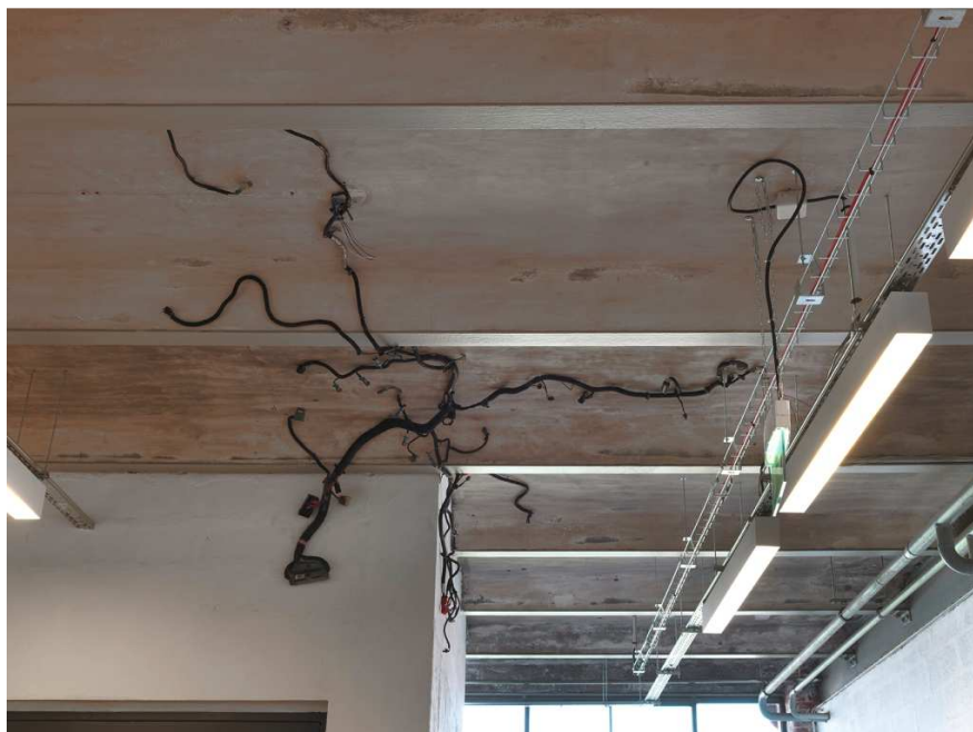
Michael E. Smith, Sans titre, 2014 Faisceau de câbles de voitures