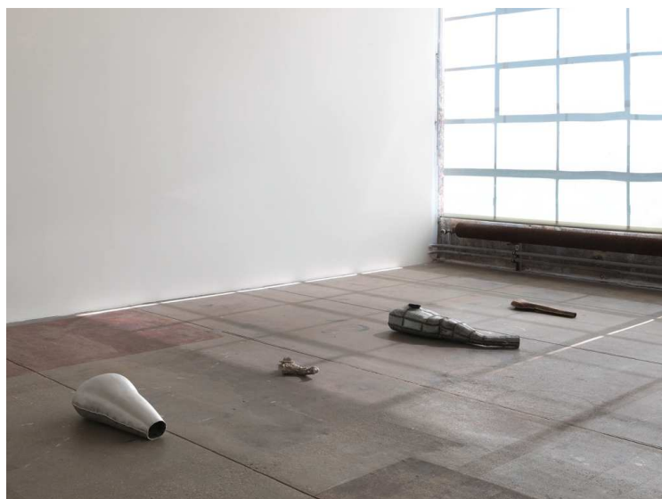
Antoine Nessi, Unknown Organs , 2014 Inox, aluminium, laiton, acier galvanisé