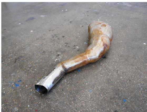
Antoine Nessi, Unknown Organs (détail), 2014