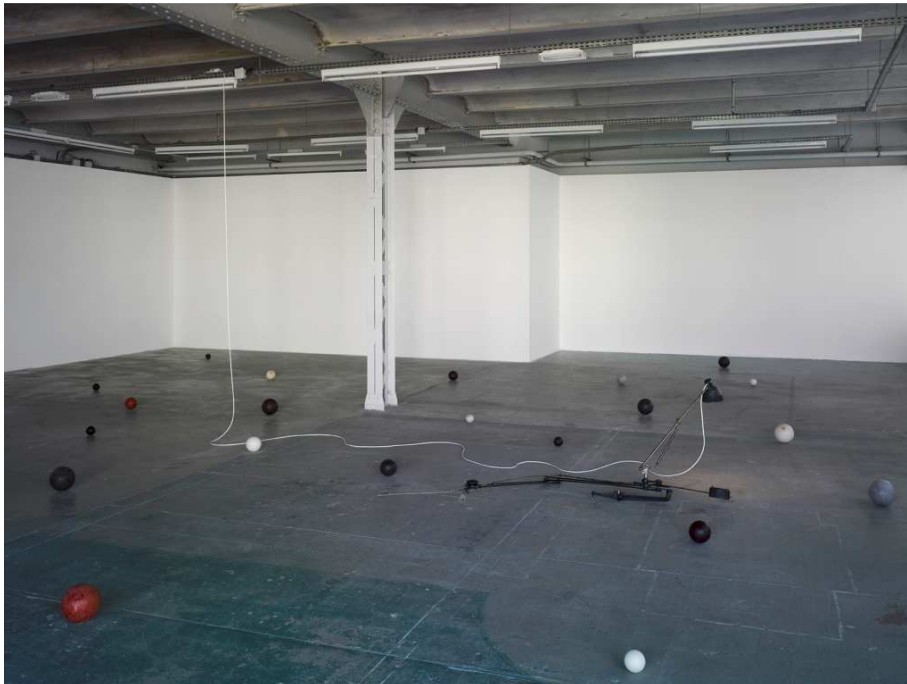
Hans Schabus, Konstruktion des Himmels , 1994 Machine à dessin, lampe, câble électrique, cire