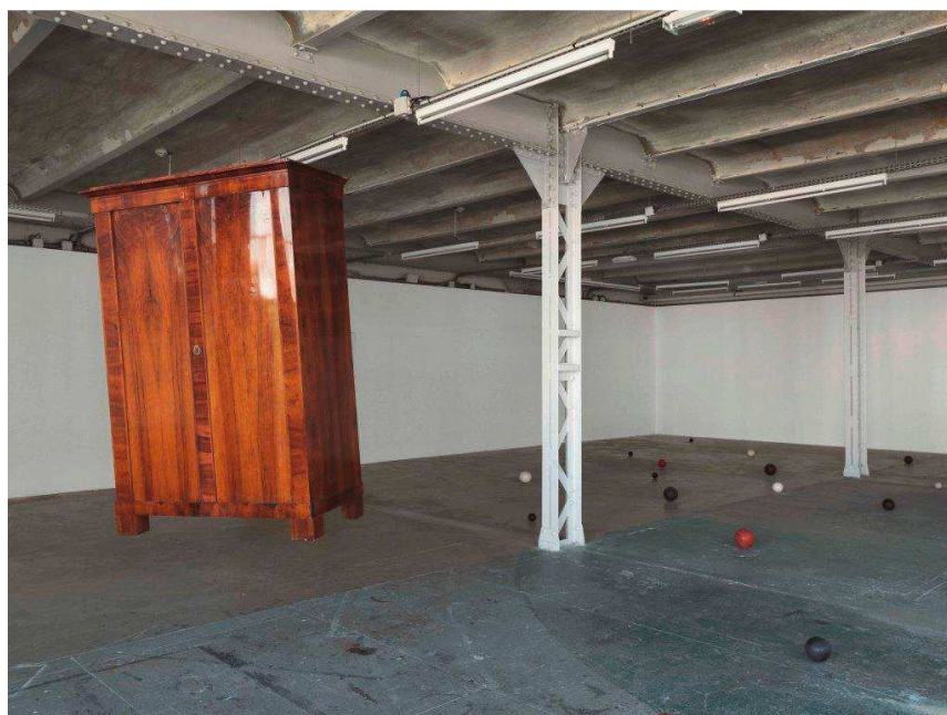
Mandla Reuter, The Agreement, Vienna , 2011 Armoire ; 198 x 129 x 85 cm