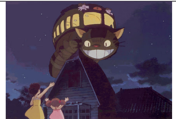
le chat bus