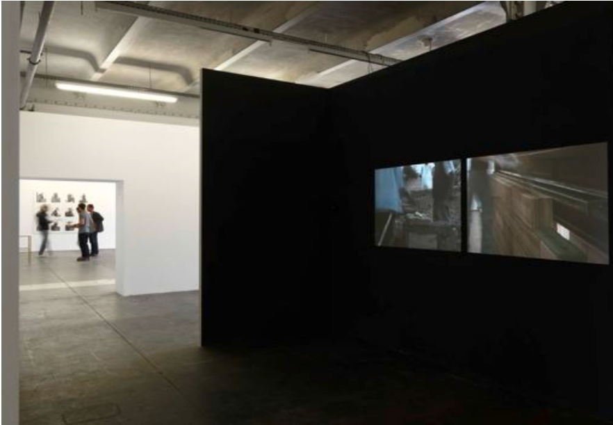
Harun Farocki, Vergleich über ein Drittes , 2007

Film 16 mm transféré sur Betacam numérique en double-projection, 24', couleur, son