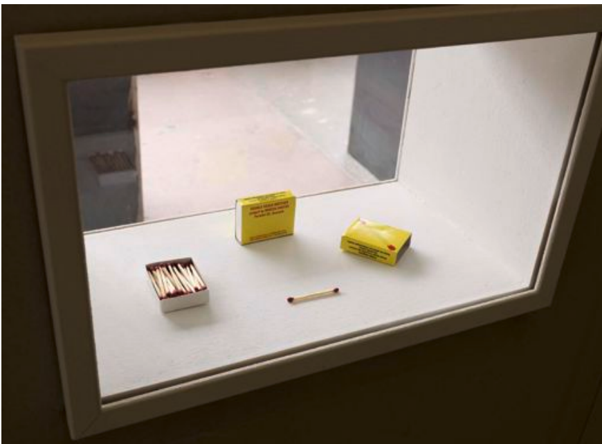
Mircea Cantor, Double Heads Matches , 2002

Installation : douze socles en acier, tissu noir, charbon, env. 120 x 40 x 40 cm (chaque)