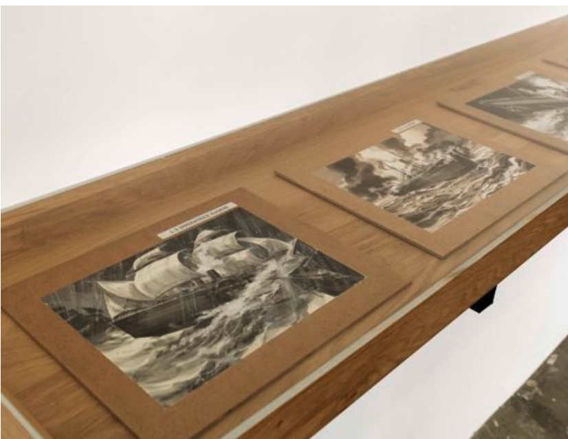
Jorge Satorre, La Part maudite illustrée , 2010

Photographies cibachrome sous Diasec sur Forex jaune, 49 x 38 cm, brochure à disposition du public