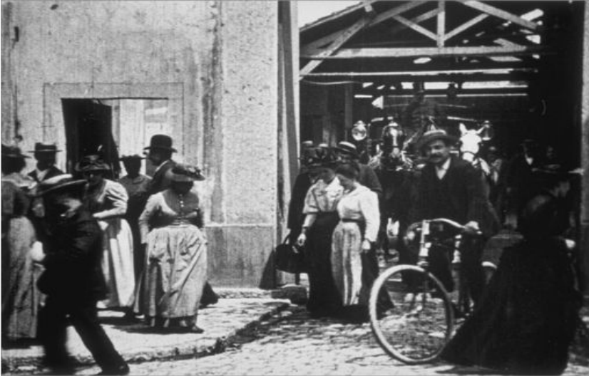
Auguste et Louis Lumière, Sortie d'usine , 26 mai 1895

(Cat. Lumière N°91-1) Pellicule Lumière 35mm, 35'' Collection Association Frères Lumière