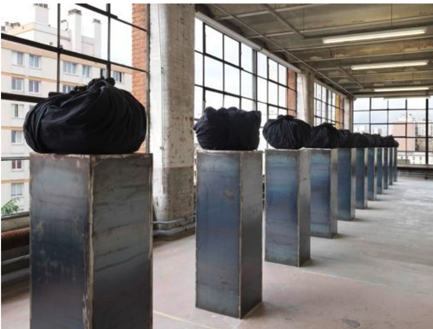
Jannis Kounellis, Sans titre , 2003

Film 16 mm transféré sur Betacam numérique en double-projection, 24', couleur, son